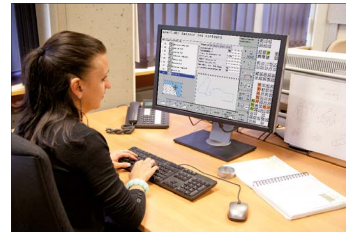
Poste de programmation avec clavier virtuel